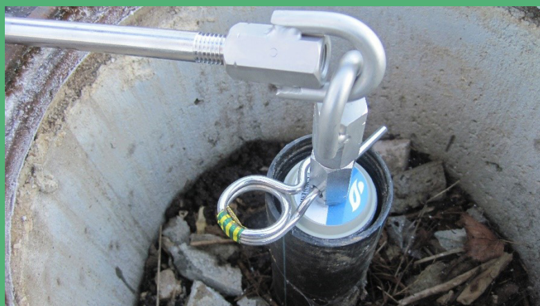
Figure 2 : Mise en place des échantillonneurs iFLUX

Les échantillonneurs iFLUX sont insérés dans les tiges filetées fournies par la société iFLUX. Le nombre de tiges filetées à mettre en place entre chaque échantillonneur et de connecteurs à insérer entre les tiges filetées est donné par le plan d'installation fourni par la société iFLUX en fonction des profondeurs d'exposition définies par l'utilisateur. Cet assemblage se fait directement au niveau de la tête du forage (voir Figure 2) et les échantillonneurs sont descendus dans le forage lentement et au fur et à mesure de l'assemblage. Un câble en inox est également fourni pour attacher l'ensemble à la tête du forage. Pour le retrait, les échantillonneurs sont sortis du forage un par un et les tiges filetées ainsi que les connecteurs démontés au fur et à mesure.