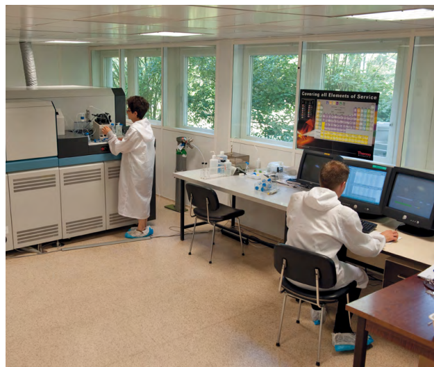
Spectromètre de masse Neptune.

L'approche isotopique du Pb peut également être couplée aux approches isotopiques de métaux soigneusement sélectionnés et identifiant le traçage de processus. Ce couplage permet une interprétation plus poussée des résultats obtenus indépendamment et une meilleure compréhension du site (discrimination des différentes sources, connaissance des processus mis en jeu). Il permet notamment de mieux comprendre les voies de transfert des polluants et le devenir des métaux dans l'environnement.