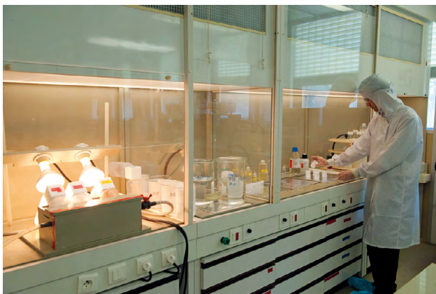
Préparation d'échantillons en salle blanche.

Les étapes préalables de préparation pour séparer et purifier le Pb du reste de la matrice sont longues, complexes et extrêmement contraignantes. Elles sont réalisées dans des laboratoires équipés de salle blanche et sous hotte à flux laminaire afin d'éviter toute contamination des échantillons par les poussières du milieu extérieur mais aussi les contaminations croisées entre échantillons.